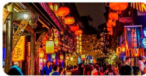
Phố Cẩm Lý