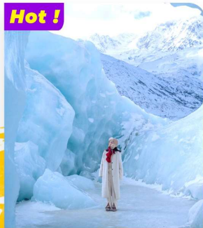
Hot ! Tham quan Đạt Cổ Băng Xuyên