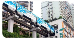
Đường Sắt Trên Cao Chạy Xuyên Qua Các Tòa Nhà Cao Tầng