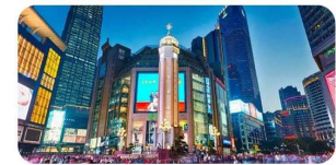
Đài Tưởng Niệm Giải Phóng