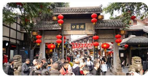
Ciqikou Old Town