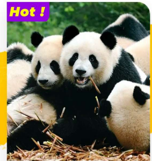
Hot ! Tham quan Gấu trúc