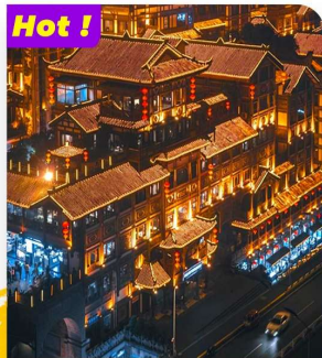
Hot ! Khám phá Hồng Nhai Động