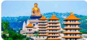
Phật Quang Sơn Tự