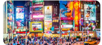
Chợ đêm Ximending