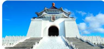
Nhà Tưởng niệm Tưởng Giới Thạch